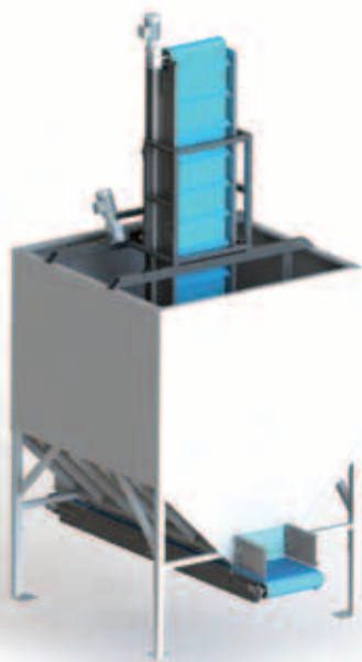
Бункеры с наклонным ленточным конвейером и реверсируемым выносным конвейером