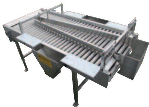
Роликовый стол-переборщик с сортировочными воронками, перегородками и разделочными досками

Роликовый стол-переборщик подходит для всех видов корнеплодных и клубнеплодных овощей. Для продолговатых овощей, например, моркови, подачу следует организовать таким образом, чтобы овощи подавались на стол в поперечном направлении. В качестве альтернативы для такого рода товара можно использовать конвейеры-переборщики, также изготавливаемые фирмой Schneider.